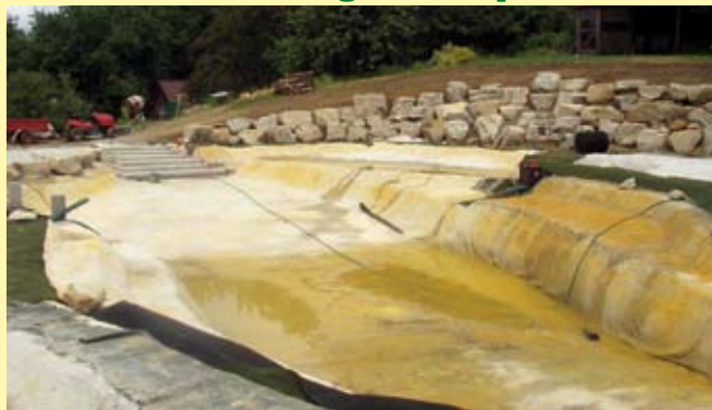
Die mit Folie, Verbundmatte und Mörtelschicht ausgekleidete und perfekt geschützte Teichdichtung