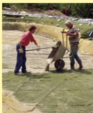
Nicht kleckern, sondern klotzen: Die Mörtelsuppe wird mit dem Besen eingearbeitet