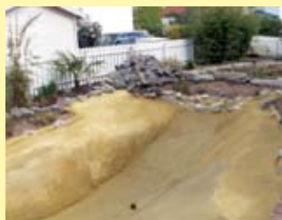
Die Verbundmatte ist mit sandfarbigem Mörtel eingeschlämmt