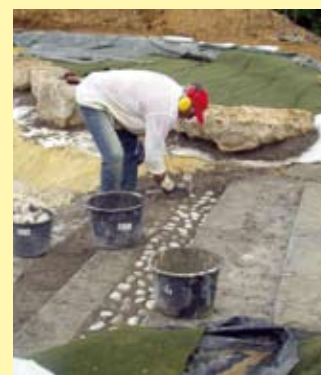
Die tonnenschwere Steinlast auf der bequemen Treppe kann die Folie nicht beschädigen