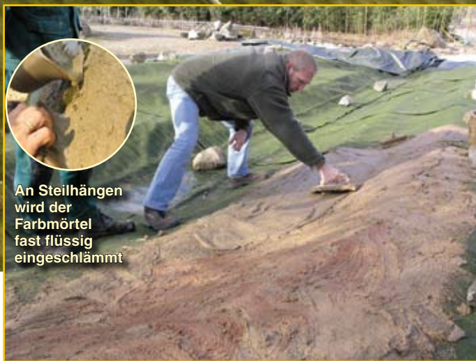
An Steilhängen wird der Farbmörtel fast flüssig eingeschlämmt