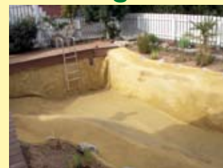
Nichts erinnert mehr an einen Folienteich. Auch die Falten sind verschwunden.

Die Folie liegt gut geschützt unter einer steinharten-Schicht.