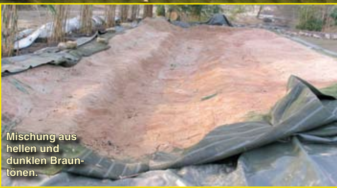
Mischung aus hellen und dunklen Brauntönen.

Die NaturaGart -Verbundmatte wird auf die Folie geklebt und mit dünnflüssigem Mörtel eingeschlämmt. Auf diese Weise entsteht eine steinharte Schutzschicht über der Folie